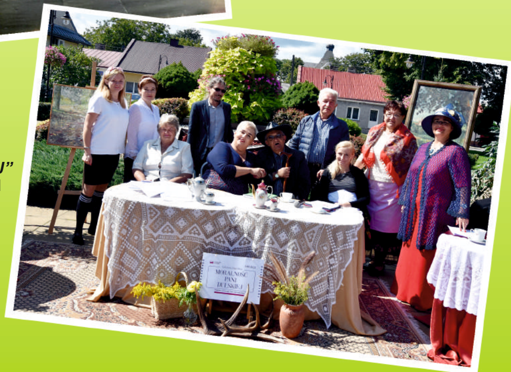
„MORALNOŚĆ PANI DULSKIEJ” - NARODOWE CZYTANIE 2021