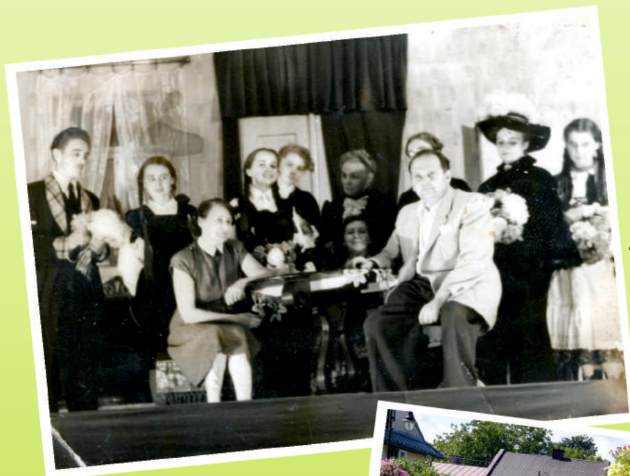
„MORALNOŚĆ PANI DULSKIEJ” - PRZEDSTAWIENIE Z 1951 ROKU

Kwartalnik wydawany przez Urząd Miejski i Bibliotekę u Kazimierza. Miejsko - Gminną Bibliotekę Publiczną im. K. Zielińskiego w Modliborzycach