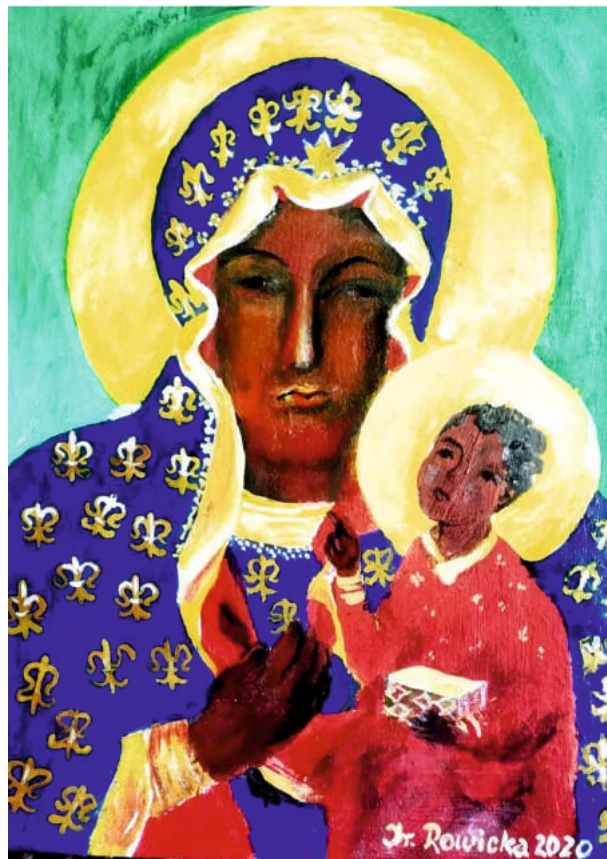
MATKA BOSKA Z DZIECIĄTKIEM - IRENA ROWICKA