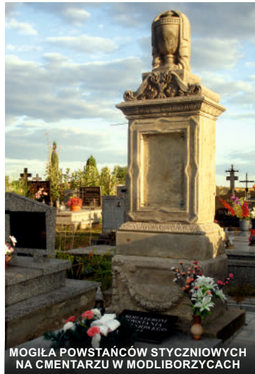
MOGIŁA POWSTAŃCÓW STYCZNIOWYCH NA CMENTARZU W MODLIBORZYCACH

1863r. skończyła się dla Rosjan porażką i dużymi stratami: „...około wsi Słupie Modliborskie stał się mały oddział powstańców z nie o wiele przeważną liczbą piechoty rosyjskiej. Piechota (rosyjska) poniosła straty zmuszona była do odwrotu a powstańcy pozostawili na placu zabitego jednego i ciężko rannego drugiego towarzysza. Nie wchodząc do wsi udali się w przyległe lasy” 72 . 29 stycznia z Janowa wysłano już siły batalionu: „trzy rot piechoty i kilka dziesięcin Kozaków”. Z janowskiego garnizonu skierowano w rejon Modliborzyc 500 żołnierzy rosyjskich. Nie mogło być mowy o lekceważeniu partii modliborzycyckiej przez Rosjan, skoro płk. Biedraga rozkazał wysłać tak duże (nieproporcjonalnie duże do sił powstańczych) siły wojskowe. Podczas arestowania Solmana